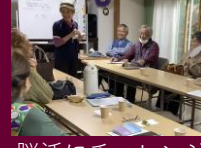
脳活にチャレンジ