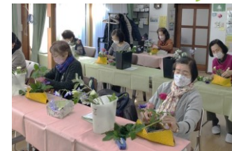
2月「黄色の器に春を楽しむ」