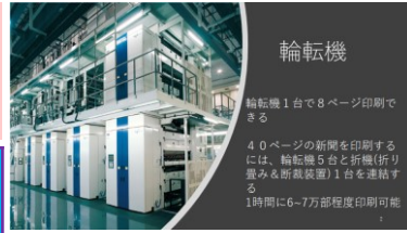
第9回新聞よもやま話