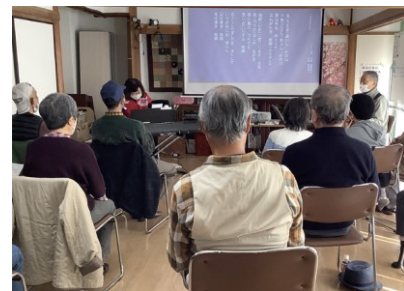
密に気をつけながらのミニ音楽会

コロナ禍のため、歌声カフェはミニ音楽会と改名し、密を避けるため、小人数の2部制としています。1、2月はまん延防止措置のためお休みしていたので、3月19日は久しぶりの開催でした。徳田さんのピアノ伴奏で童謡・唱歌・ポップスなど皆さんの元気な声を聴くことができました。みんなと会って声を出すことは、体や気持ちのフレイル予防になります。なんと、1月2月3月生まれの方は、9名もいらして、この日がお誕生日の方もいらっしゃいました。