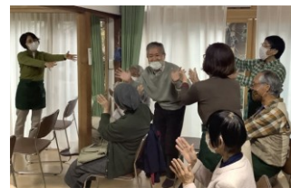
誕生日おめでとう！